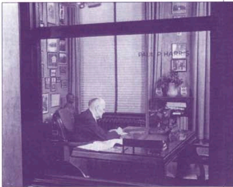
Почетният президент на РИ в средата на 40-те години в кабинета си в Централата на РИ - Чикаго