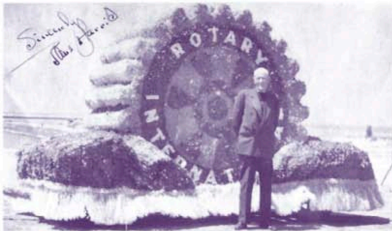
Снимка с автограф на Пол от Ротари парада в гр. Манисти, щат Мичиган, 1940 г.

След завръщането си във Филаделфия отпътува за Чикаго, за да посети